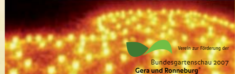
Verein zur Förderung der Bundesgartenschau 2007 Gera und Ronneburg

10 Mittelalterlager 14-01 Uhr Mittelalterliches Ritterlager vom "Volk von Caraslan" e.V. mit Ritterkämpfen, Bogenschießen, Schatzsuche, Lagerleben, Handwerk, Vorträgen von Gelehrten und Wahrsagerei 14:00 Uhr Öffnung der Schwertkampfarena und Beginn der Schatzsuche 16:00 Uhr Schaukämpfe der Ritter 18:00 Uhr Der König hält Gericht