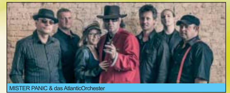
MISTER PANIC & das AtlanticOrchester

1 VEOLIA-Bühne 14:00 Uhr Eröffnung des Hofwiesensparkfestes durch Geras Oberbürgermeisterin Dr. Viola Hahn anschl. Sportrevue Gera mit den Angels Cheerleadern, der Rhythmischen Sportgymnastik des TSV 1880 Gera-Zwötzen e.V., dem Empfang der Promo-Tour für die 31. Internationale Lotto-Thüringen Ladies Tour in Gera und der Tanzschule Katja Paunack Infos und Moderation mit Collage Gera Blasmusik mit den Original Schnaudertaler Musikanten 15:30 Uhr Eröffnung der Lichternacht zum Hofwiesensparkfest durch Geras Oberbürgermeisterin Dr. Viola Hahn und den BUGA-Förderverein 19:10 Uhr Groove Daddys...einfach fetter Sound 23:00 Uhr MISTER PANIC & das AtlanticOrchester Die Udo Lindenberg Show