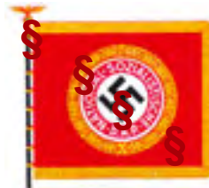
Fahne der alten Garde