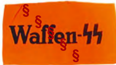
Armbinde der Waffen-SS