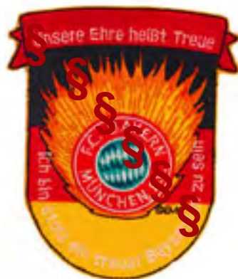
Fan-Abzeichen mit SS-Losung