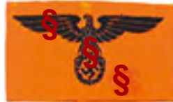
Armbinde mit Adler und Hakenkreuz