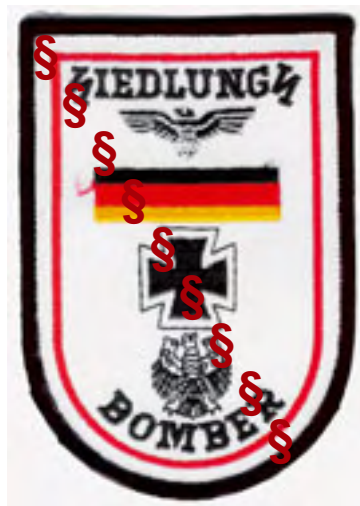
Abzeichen mit Sigrunen