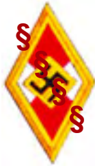
Ehrenabzeichen der HJ