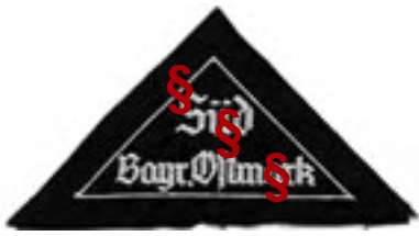
Gauabzeichen (2-zeilig silber)