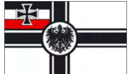
Beispiel: Reichskriegsflagge 1867-1921

Die Führung der „Reichskriegsflagge“ erfüllt weder einen Tatbestand des Strafgesetzbuches noch des Ordnungswidrigkeitengesetzes. Dennoch kann die „Reichskriegsflagge“ nach allgemeinem Polizei- und Ordnungsrecht dann sichergestellt werden, wenn dies in konkreten Einzelfällen die erforderliche, geeignete und verhältnismäßige Maßnahme ist, um konkrete Gefahren für die öffentliche Sicherheit und Ordnung abzuwehren. Das ist z.B. dann der Fall, wenn die Flagge Kristallisationspunkt einer konkret drohenden Gefahr ist und diese sich dadurch beheben lässt. Die Verwendung und Verbreitung der Reichskriegsflagge von 1935-1945 ist jedoch gem. §§ 86, 86a, StGB strafbar (s. Kap. 4)