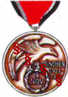
Abzeichen am Band vom 9. Nov. 1923 (Blutorden)