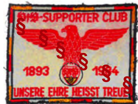
Fan-Abzeichen mit SS-Losung