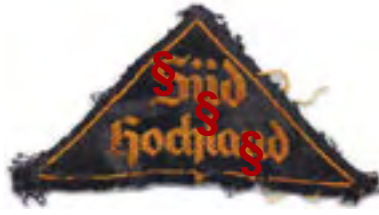
Gauabzeichen (2-zeilig gold)