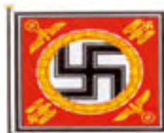
Standarte des Führers