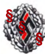
Ehrenzeichen des NSD-Studentenbundes