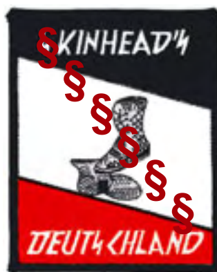
Skinhead-Abzeichen mit Sigrunen