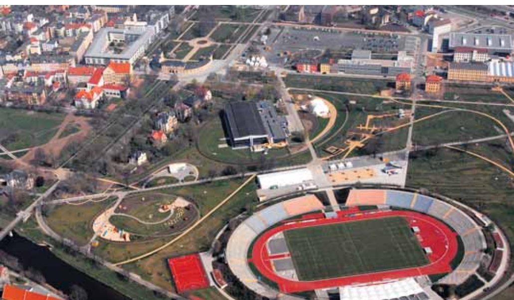
Das Geraer Buga-Gelände aus der Vogelperspektive.

Hier enden die „Öffentlichen Bekanntmachungen der Stadt Gera“.